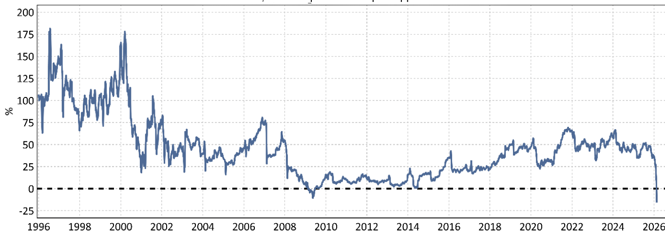
Groupe sectoriel Logiciels et Services – S&P 500 Prime du ratio cours/bénéfice prévisionnel par rapport à l'indice S&P 500